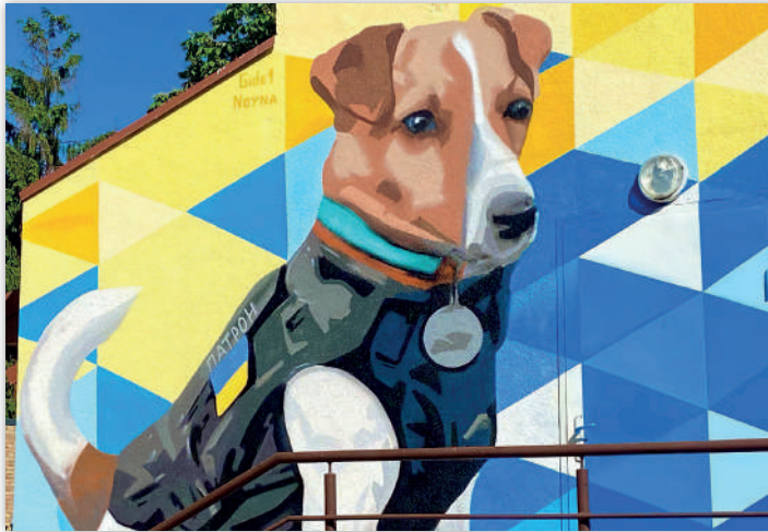
Рис. 6. Пес-сапер Патрон

постатей, зокрема М. Грушевського, гетьмана Скоропадського в Києві, які нагадують нам про ватних особистостей, історичні події, виконуючи просвітницьку функцію.