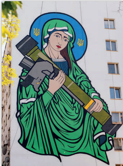
Рис. 7. «Свята Джавеліна»

Так, у 2021 р. вперше з'явився мурал із закликом про важливість медіаграмотності та критичного мислення. Стінопис створений у межах міжнародного проекту «ARTIFAKE» (розшифровується як «мистецтво захоплює фейк»), основною ідеєю якого є боротьба з пропагандою.