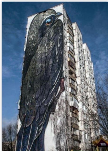
Рис. 1. «Стриж», автор А. Максимов

В. Поднос та ін. (2016) вважають, що стінописи набули своєї популярності у зв'язку з заміною радянської мозаїки, яку наразі демонтують згідно з законодавством (Закон «Про засудження комуністичного та націонал-соціалістичного (нацистського) тоталітарних