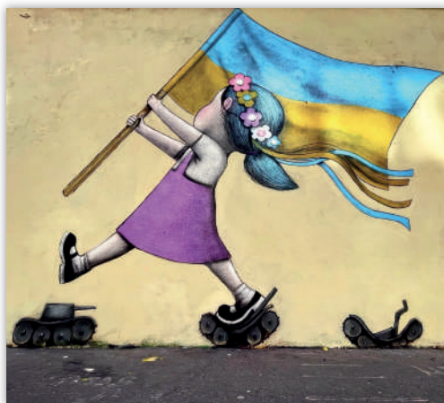
Рис. 12. «Україна в дії», автор Ж. Маллан (Seth)