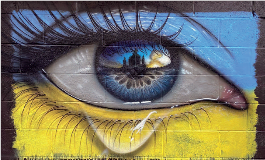
Рис.13. «Око людини», автор mydogsighs

синьо-жовтим прапором, відображає незламність духу українського народу, протистояння ворогу, безстрашність і водночас усвідомлення основної ідеї боротьби.