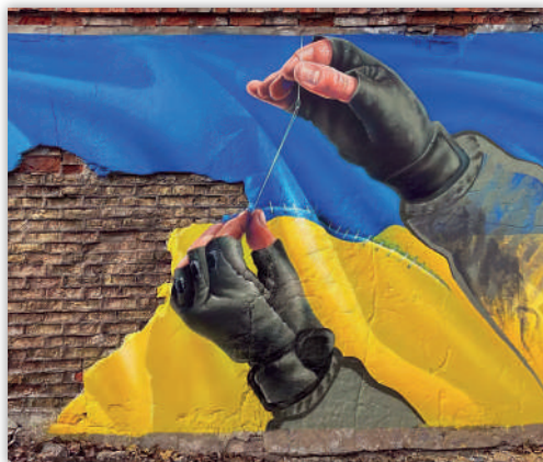
Рис. 11. «Український військовий шиває прапор України», автор О. Корбан

Майже кожне місто України висловлює спротив російській агресії, мотивує до перемоги й втілює віру в краще через інформаційний текст простору. Варто зауважити, що в містах Європи також спостерігаємо мурали як символ незламності українського народу. Серед найвідоміших слід виокремити стінопис у Франції (автор — Ж. Маллан (Seth) «Україна в дії» (Рис. 12). Зображення дитини в образі України, яка нищить ворожу техніку, крокуючи з