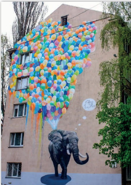
Рис. 4. «Мрія слоненяти», автор О. Корбан

режимів в Україні та заборону пропаганди їхньої символіки» 2015 р.).