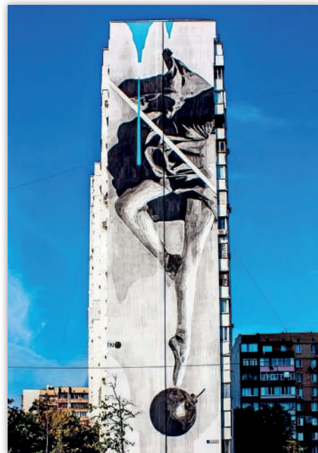
Рис. 2. «Балерина, що танцює на вибухівці», автор Іно