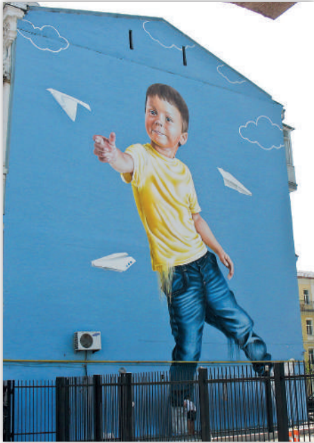
Рис. 3. «Паперові літачки», автор О. Корбан