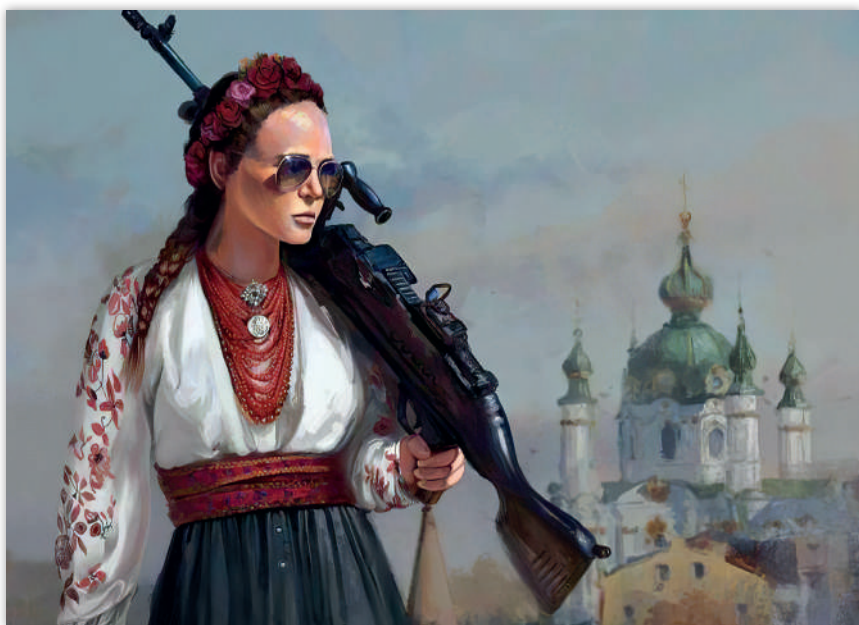
Рис. 9. «Красавица терпяти не буде», автор К. Качановський

свободи, жаги до життя, перемоги над ворогом є основними ідеями муралів, які з'являються на вулицях українських міст. Яскраві стінописи також уособлюють єдність, боротьбу, інформаційний спротив, водночас сприяючи моральному піднесенню містян.