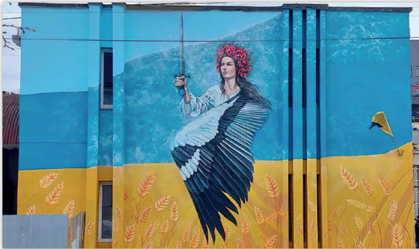
Рис. 10. «Україна-переможе», автори — Є. Фуллен, О. Янко

Можемо спостерігати, що героями вуличного мистецтва стають і відомі особистості в певних образах (Президент України В. Зеленський. Рис. 6, очільник Миколаївської обласної військової адміністрації В. Кім. Рис. 5), «Привид Києва», і пес-сапер Патрон (Рис. 6), і вигадані образи, до прикладу «Свята Джавеліна» (Рис. 7) та ін.