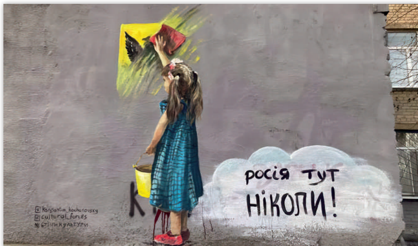
Рис. 8. «росія тут НІКОЛИ!», автор К. Качановський

свободи, жаги до життя, перемоги над ворогом є основними ідеями муралів, які з'являються на вулицях українських міст. Яскраві стінописи також уособлюють єдність, боротьбу, інформаційний спротив, водночас сприяючи моральному піднесенню містян.